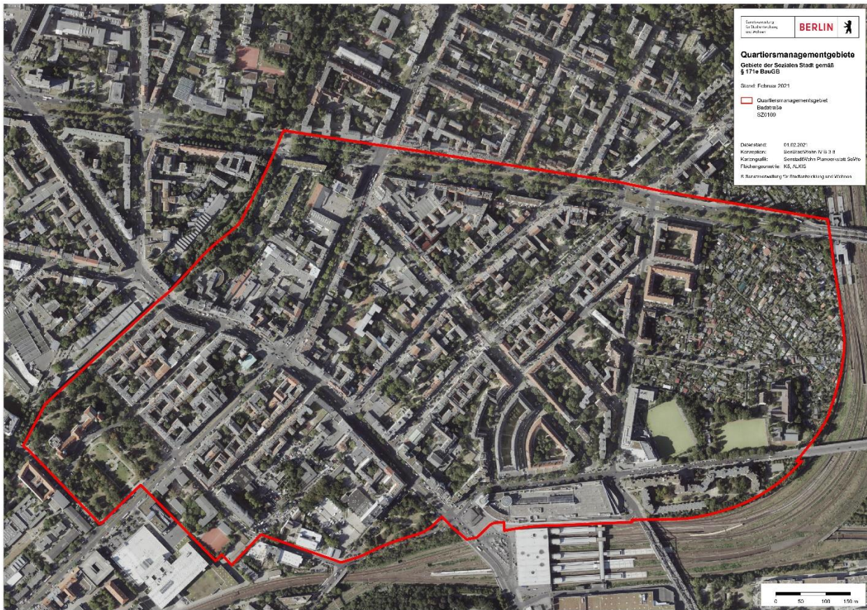
Abbildung 1: Gebietskulisse des Fördergebiets Badstraße (Programm Sozialer Zusammenhalt)

L.I.S.T. – Lösungen im Stadtteil Stadtentwicklungsgesellschaft mbH